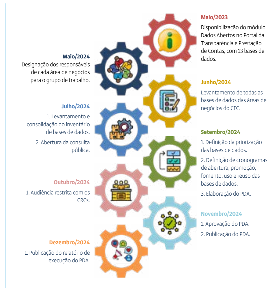
Figura 2 - Etapas para construção do Plano de Dados Abertos do Sistema CFC/CRCs.

7. Publicação do PDA em uma linguagem simples e objetiva.